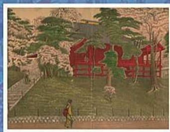
【上野清水観音之景】 濱水市郎 明治20年(1887)