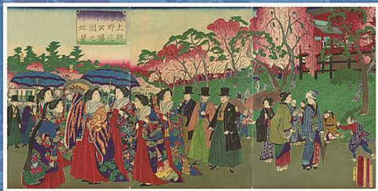
【東京名所之内 上野公園地桜花盛之景】 歌川広重(三代) 明治13年(1880)