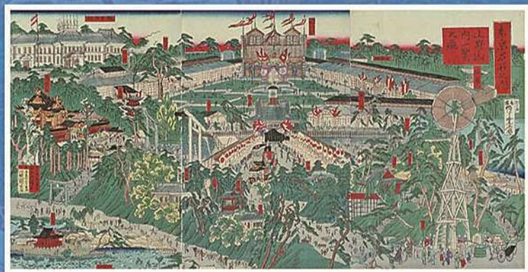
【東京名所之内 上野山内一覽之図】 河精映齋 明治10年(1877)