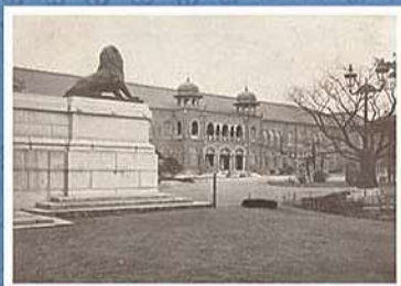
【皇室博物館】 【東京風景】より 明治44年(1911)

表:右よから 【東京名所 上野東照宮】 建辺忠久 明治23年(1890) 【東京風俗 椿つくし ふくろう】 楊洲蘭廷 明治22年(1889)頃 【東京名所之内 上野公園地不忍見噴田】 歌川広重(三代) 明治9年(1876) 表景:【上野公園地 博覧会御旗集田】 追斎 明治10年(1877)