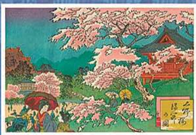
【東京名所 上野桜満開の図】 番茶 明治31年(1898)