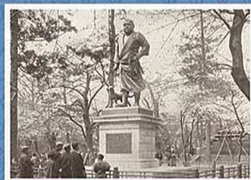
【西郷翁銅像】 【東京風景】より 明治44年(1911)